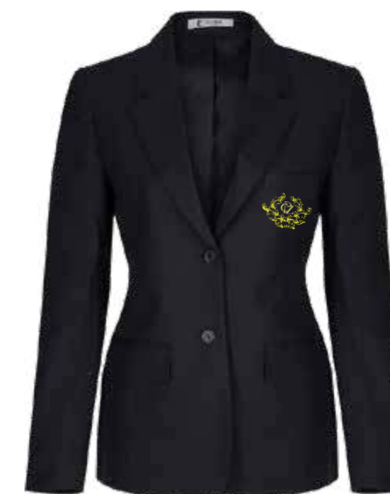
Granatowa marynarka damska AGB-NVY