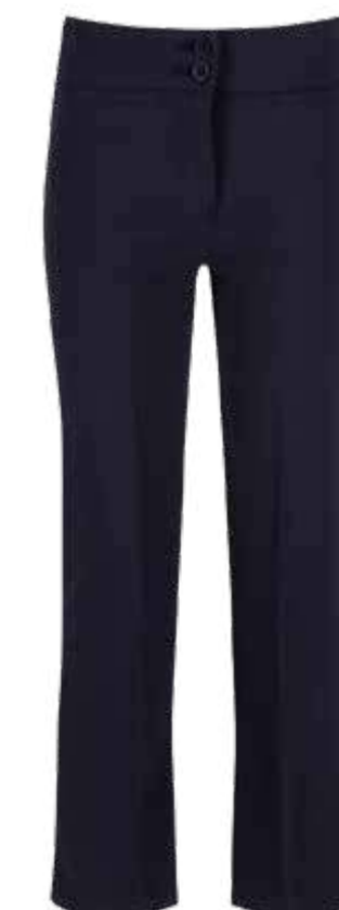
Granatowe spodnie dziewczęce JGTN-NVY