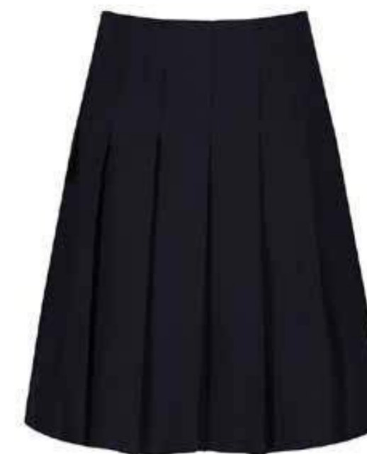
Granatowa spódnica plisowana JGPB-NVY