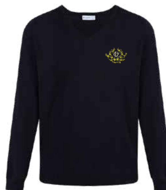
Granatowy sweter (przez głowę) CBV-NVY