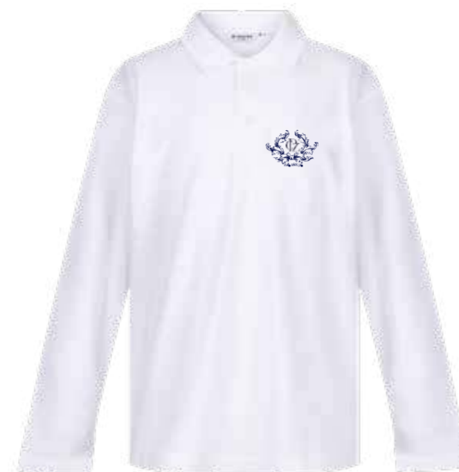
Biała koszulka polo długi rękaw KEL-WHT