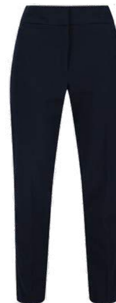
Granatowe spodnie damskie GTI-NVY