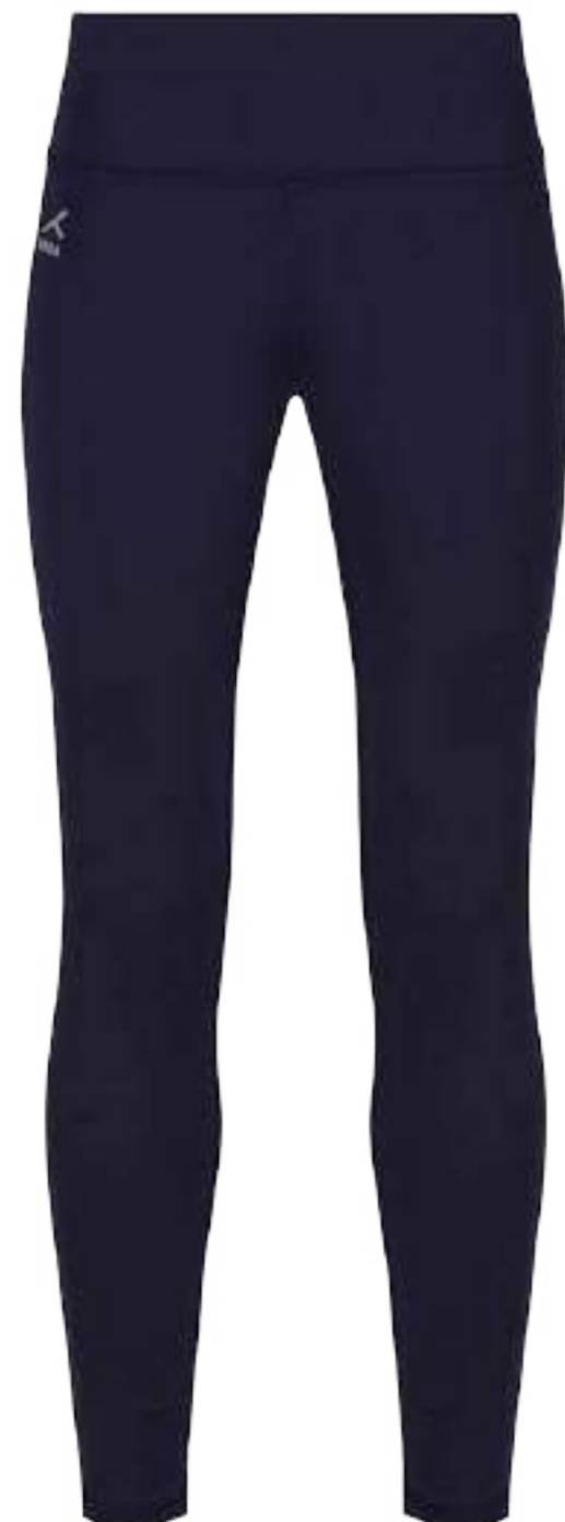
Granatowe szorty sportowe