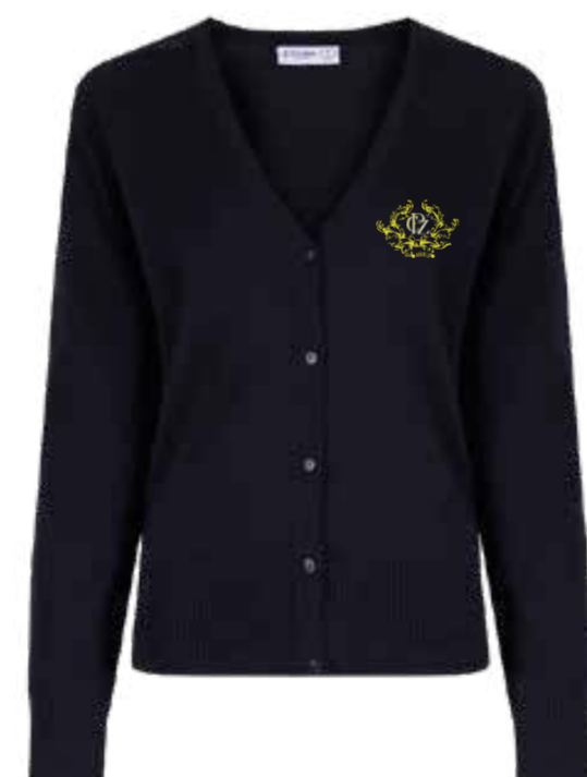
Granatowy cardigan CBC-NVY