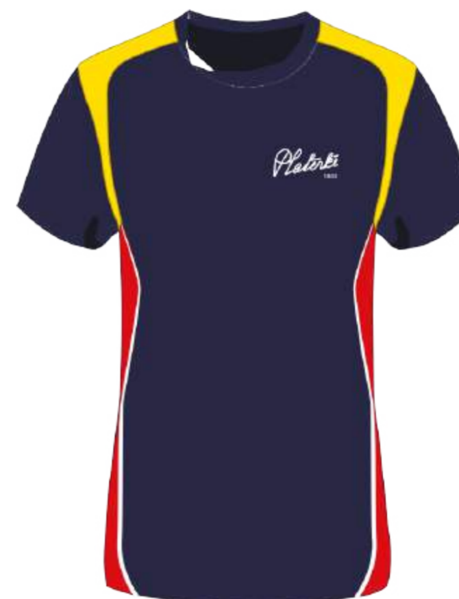
Koszulka sportowa vortex