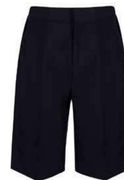
Granatowe krótkie spodnie męskie TSH-NVY