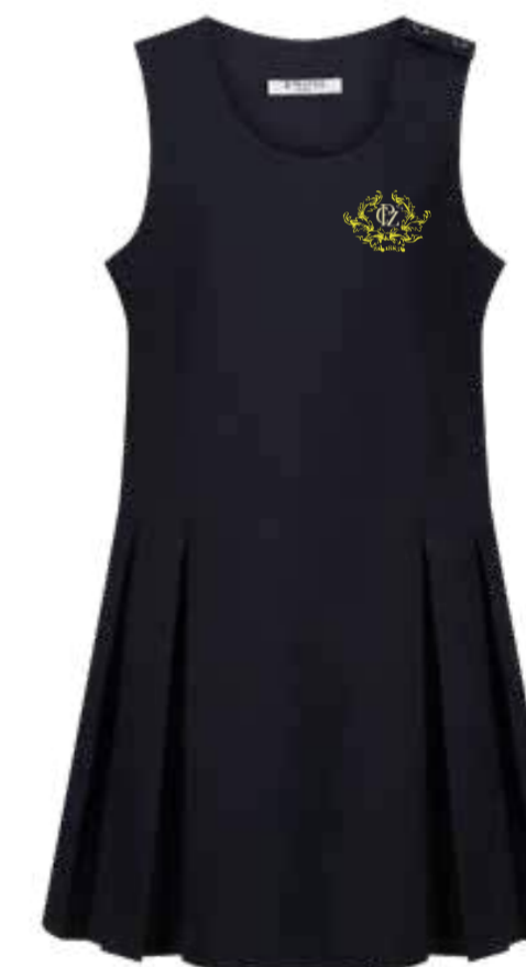
Granatowa sukienka ... JPP-NVY