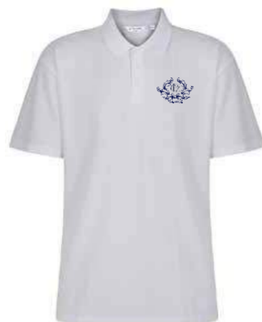
Biała koszulka polo KES-WHT