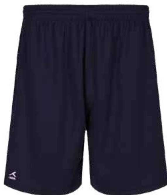
Granatowe szorty sportowe