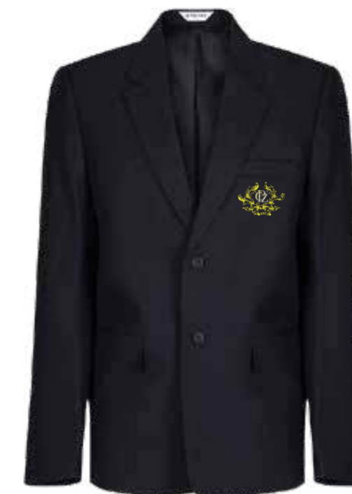
Granatowa marynarka damska ABB-NVY