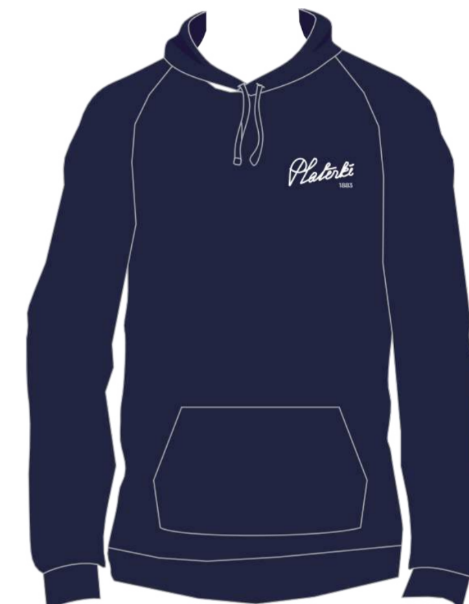
Granatowa bluza z kapturem