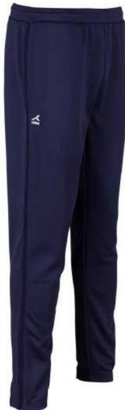
Granatowe spodnie dresowe