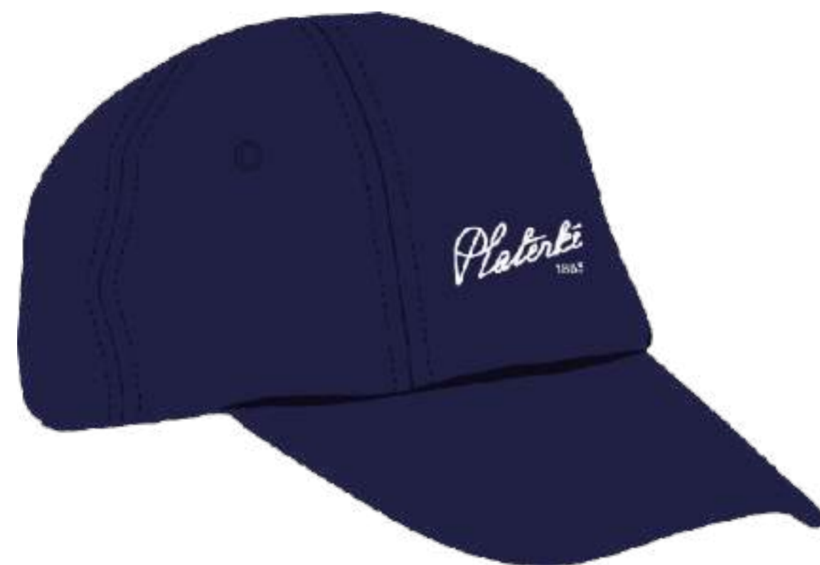
Czapka "baseball'ówka" BC 1455/57