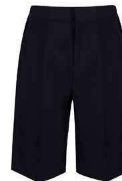
Granatowe krótkie spodnie damskie TSH-NVY