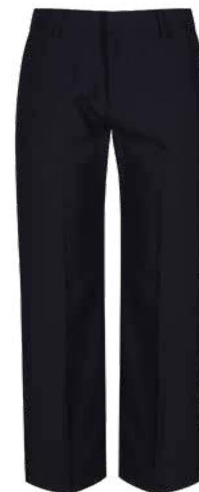
Granatowe spodnie chłpięce CFJ-NVY