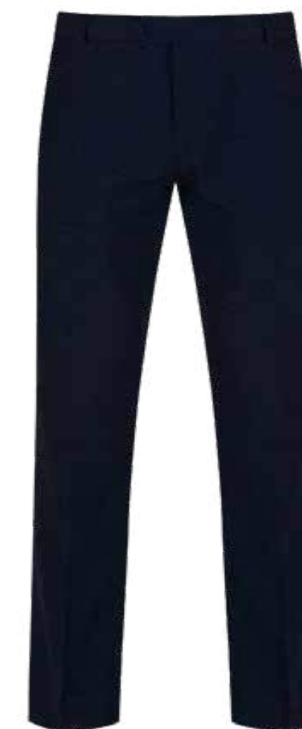
Granatowe spodnie męskie TLT-NVY