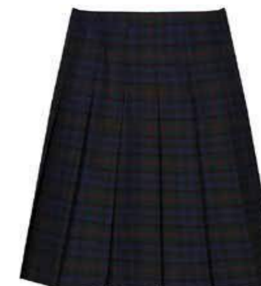
Spódnica w kratę (tartan) plisowana GST-JUB